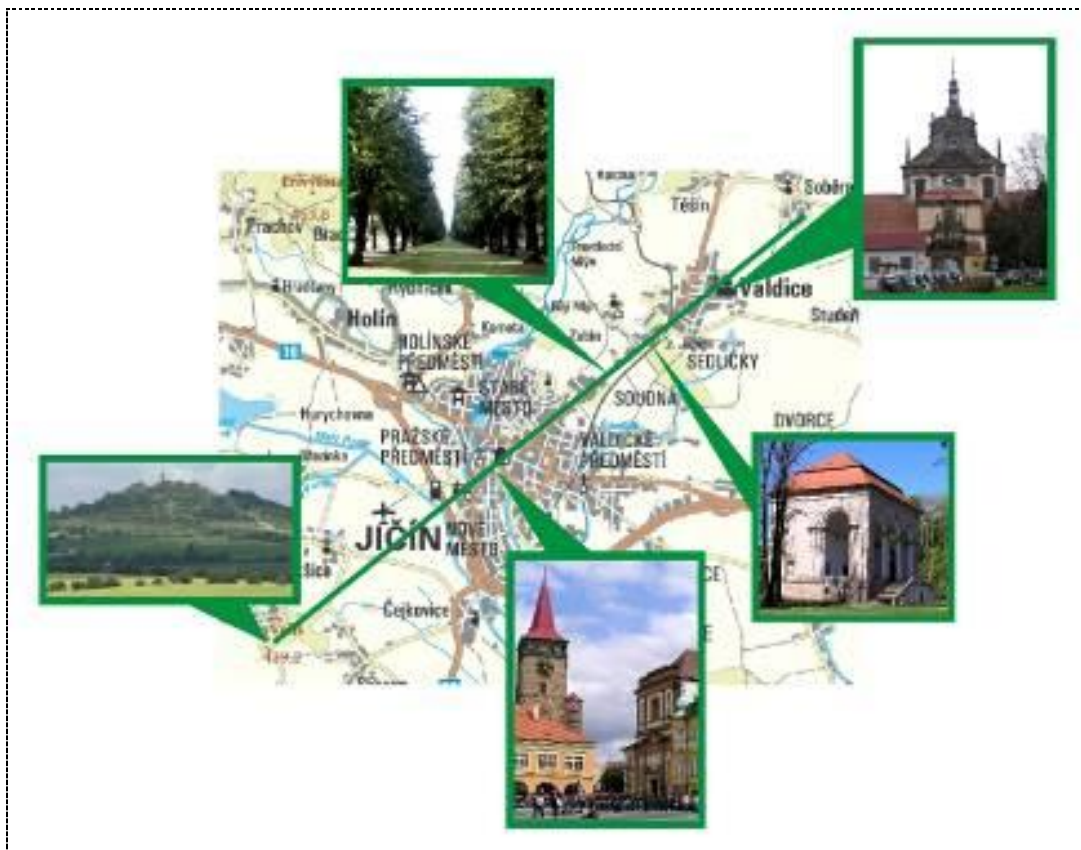
Obrázek č. 2 – Schéma Valdštejnovy zahrady