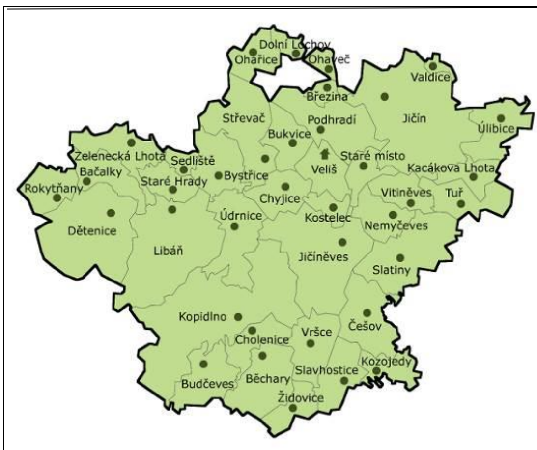
Obrázek č. 1 – Zájmové území Otevřené zahrady Jičínka z. s.

Hlavním cílem spolku je veřejně prospěšný udržitelný rozvoj zájmového území (viz obrázek č. 1), a to činnostmi ve prospěch obyvatel a návštěvníků, obcí, neziskových organizací, drobných podnikatelů a živnostníků, malých a středních podniků a dalších subjektů, které zde působí.